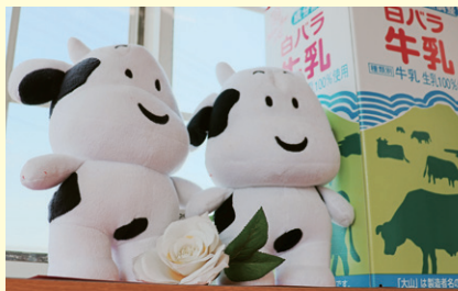
▲カウイーもお待ちしています