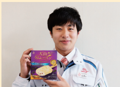
食感も楽しめますよ!

も可能です。 大切な人と祝う記念日を大山乳業農協の特別なケーキでお祝いしてみたいかがでしょうか。 詳しい購入方法・ご予約方法については、営業課までお問合せ下さい。