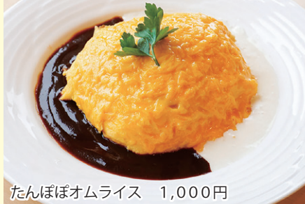
たんぼぼオムライス 1,000円