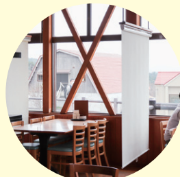
パーティションの設置