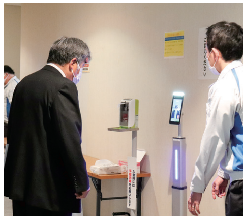
サーマルカメラを設置しました