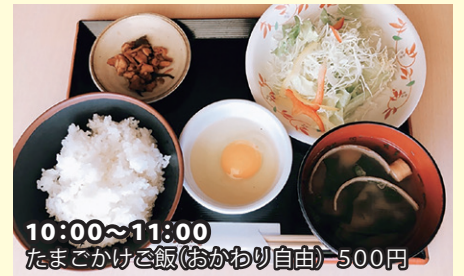
10:00~11:00 たまごかけご飯(おかわり自由) 500円