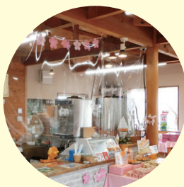
パーティションの設置