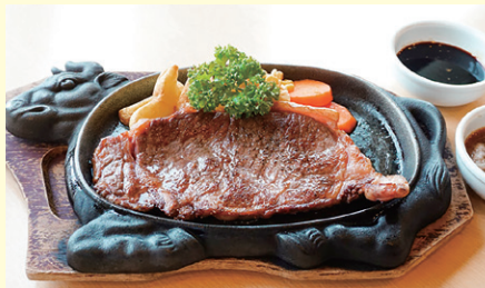
鳥取県産F1サーロインステーキ180g 2,280円

また、サーマルカメラと手指消毒器の設置や施設内のドアノブ・テーブル・椅子等のアルコール除菌など、お客様が安心してお楽しみいただける施設づくりを心掛け皆様のご来場をお待ちしています。