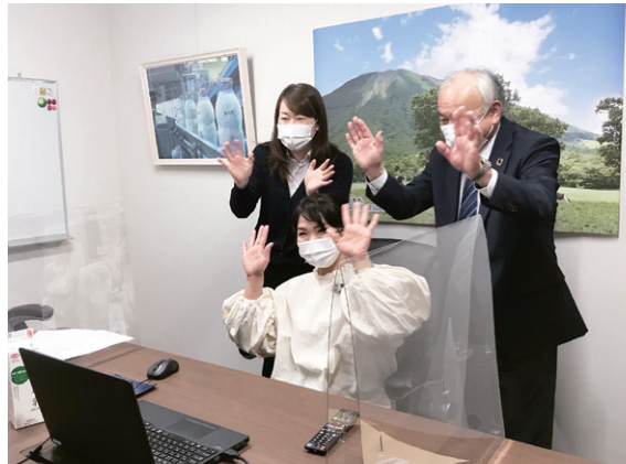
生協組合員の皆さんとリモートで交流しました